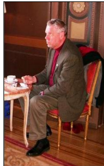
Ny i styrelsen, sekreteraren

- Detta är en av de frågor vi gick till val på. Att förenkla och minska byråkratin går därför som en röd tråd genom regeringens arbete, sa jordbruksminister Eskil Erlandsson (c) i